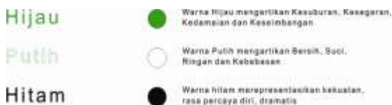
Gambar 3 Filosofi Warna