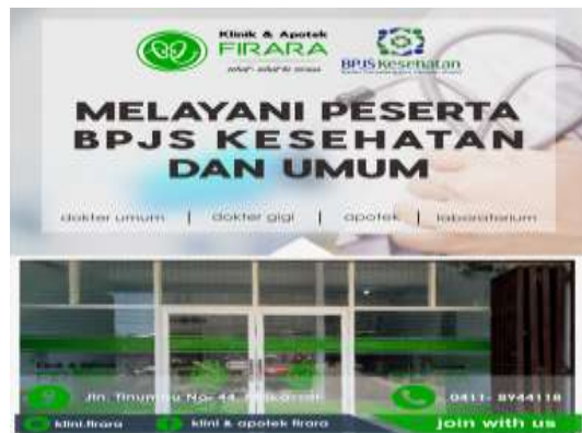
Gambar 5 Outdoor