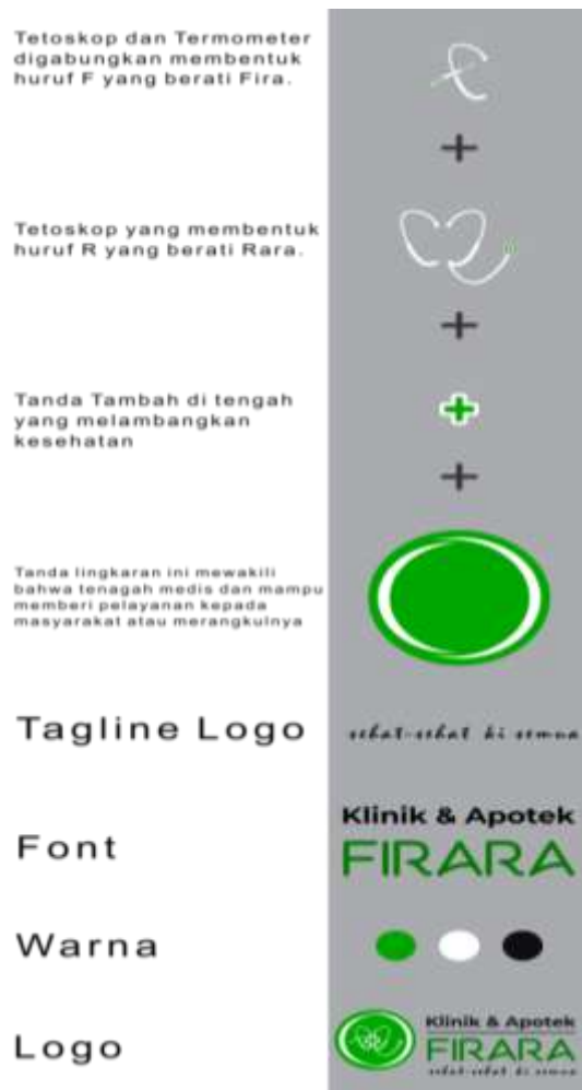
Gambar 2 Filosofi Logo

Jenis Desain Logo Klinik dan Apotek adalah menggunakan jenis Abstract Marks, jenis logo ini terdapat sebuah elemen dan sebuah inial nama yang mewakili sebuah Klinik dan Apotek Firara, sebagai berikut :