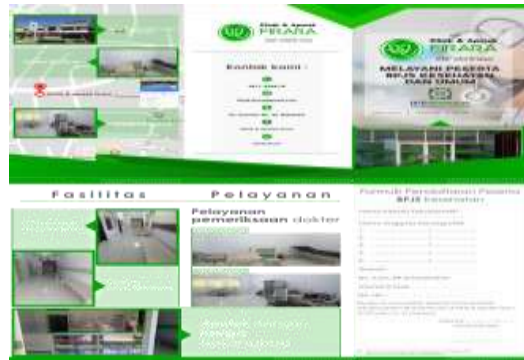
Gambar 3 Brosur