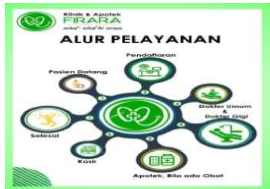
Gambar 4 Indoor