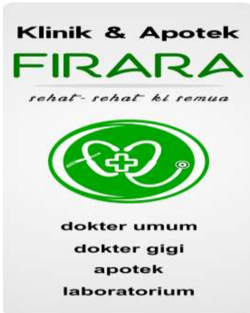
Gambar 7 Neon Box